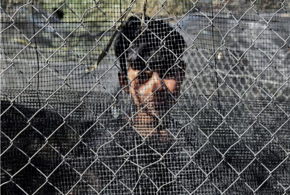
Νεαρό αγόρι στη Ζώνη 11 του Ελαιώνα, έξω από τη Μόρια. Αύγουστος, 2020.

Ενημέρωση για το «hotspot» της ΕΕ στη Μόρια, από το Ελληνικό Συμβούλιο για τους Πρόσφυγες & την Oxfam